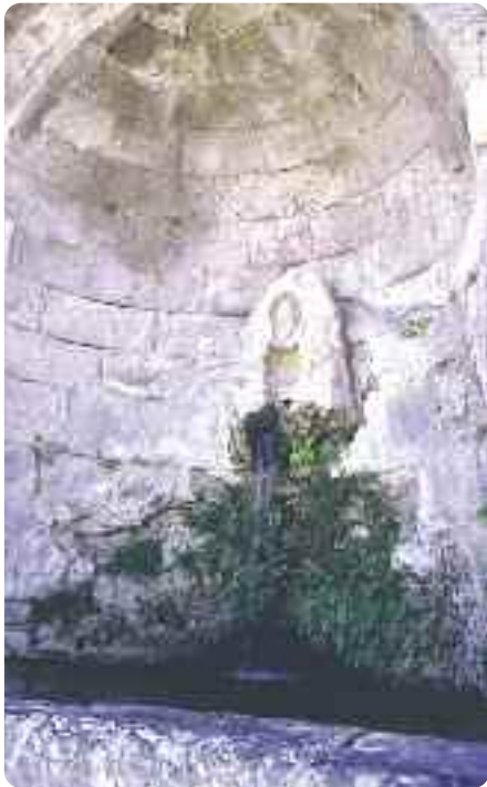
Abb. 2: Quelle im Asklepion von Kos

Der Organismus bzw. das einzelne Individuum wurde in der Naturheilkunde schon immer als Ganzheit, die mehr als die Summe ihrer Teile ist, angesehen. Dem entspricht auch die Denkweise, dass das Arzneimittel von vornherein als Gesamtheit verschiedener Teile angesehen wird, dessen synergistisches Zusammenwirken eine qualitativ höhere Wirkung ergibt, als es sich aus der Summe der Bestandteile vermuten ließe (entspricht auch dem Bürgischen Gesetz). Die Erkenntnis des multifaktoriellen Informationsflusses führt nur folgerichtig zu der Überlegung: Eine komplexe Herausforderung verlangt nach einer komplexen Therapie!